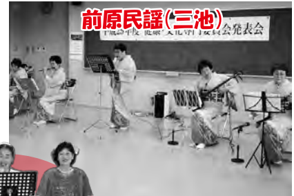
前原民謡(三池)発表会