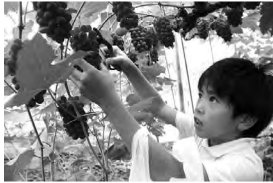
▲デラウェアの収穫作業に励む児童

子ども達は、JA指導員よりハサミの使い方など収穫の仕方を教わると、初めて入る園地に大はしゃぎで、夢中になって収穫を楽しんでいました。また、収穫したデラウェアを両手いっぱい抱え「こんなにたくさん収穫できた」と笑顔で話し、収穫の喜びを感じていました。