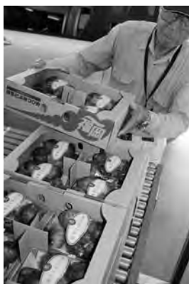
▶自慢のいちじくを選果場に持ち込む生産者

担当職員は「現在、生育は順調で糖度も例年並みに高い仕上がりになっていきます。生産者が丹精こめて生産されたいちじくを多くの方にご賞味いただきたいです」と話しました。