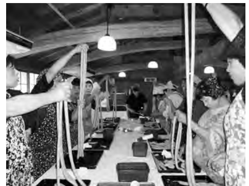
▲腸詰め作業に挑戦する女性部員