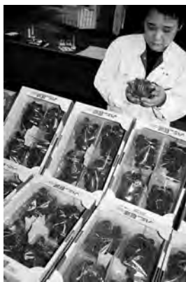
▶出荷されたぶどうの品質を確認する指導員