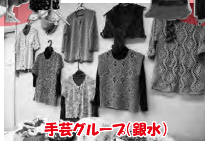
手芸グループ(銀水)