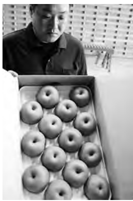
▶出荷された梨の品質を確認する担当者