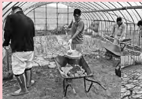
▲土砂の掻き出し作業に励む職員

この支援活動は、JAグループ福岡災害対策本部が県内のJAへ協力を依頼。JAみなみ筑後では、現地への人的支援として、7月18日～8月12日の期間7班集体で、JA男性職員の42人を被災地へ派遣し、JA筑前あさくら管内の農家組合員の圃場や集出荷施設等で農業施設の後片付け、圃場・側溝等の土砂掻き出し等の支援作業を行いました。