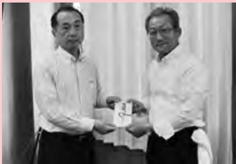
▶集まった見舞金を手渡す乗富組合長(写真左)

情報の提供は、 JAみなみ筑後お近くの支所または総務課まで! 電話：0944-63-8802