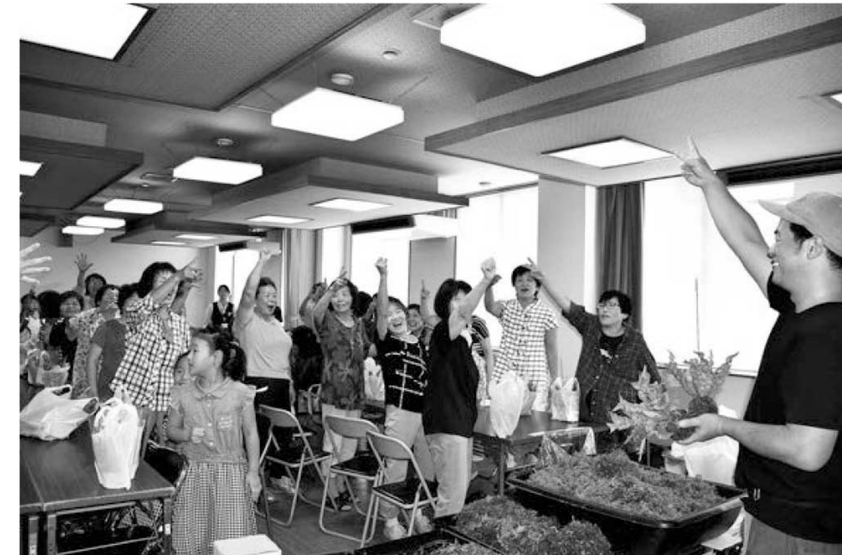
▲じゃんけんして勝利した2名に先生作の苔玉がプレゼントされました☆

苔玉とは、植物の根を用土で球状につつま、その周りにコケ植物を貼り付け糸で固定したものでインテリア植物としてとても人気があります。今回は鮮やかな緑色と波打つような形の葉が特徴の「エメラルドウェーブ」というシダ植物を使用し、苔玉を作りました。