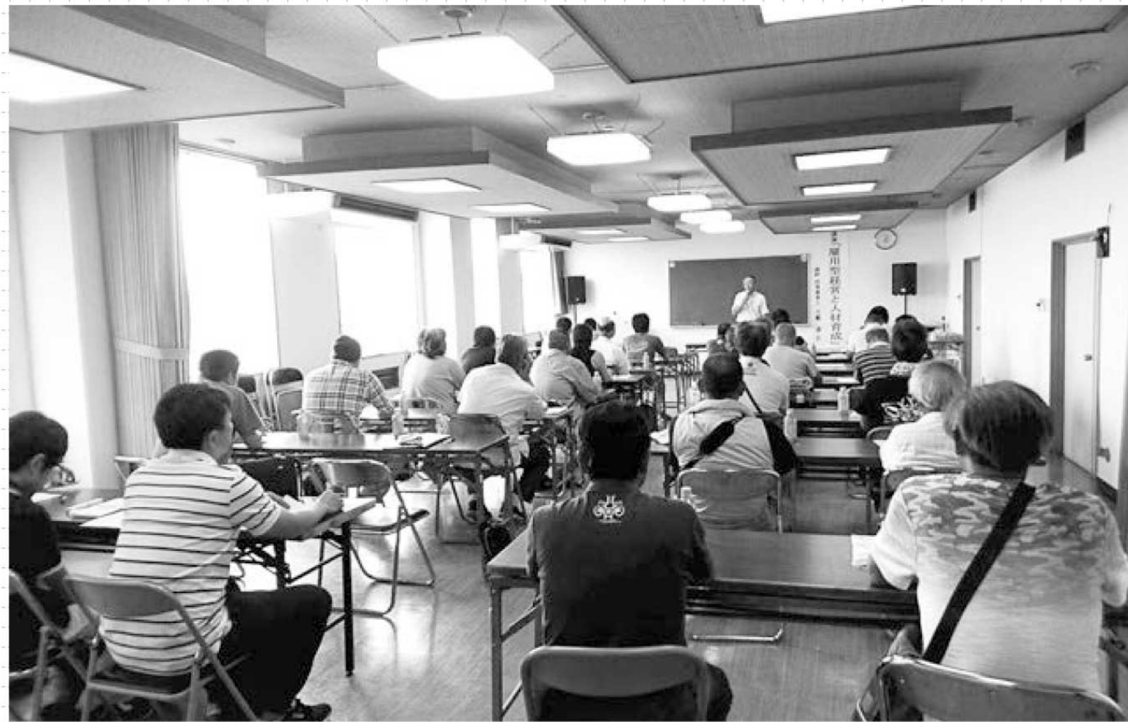
▲しっかりと耳を傾ける参加者ら

大牟田市認定農業者連絡協議会は7月25日、銀水支所で全体研修会を開催し、管内の認定農業者ら33名が参加しました。