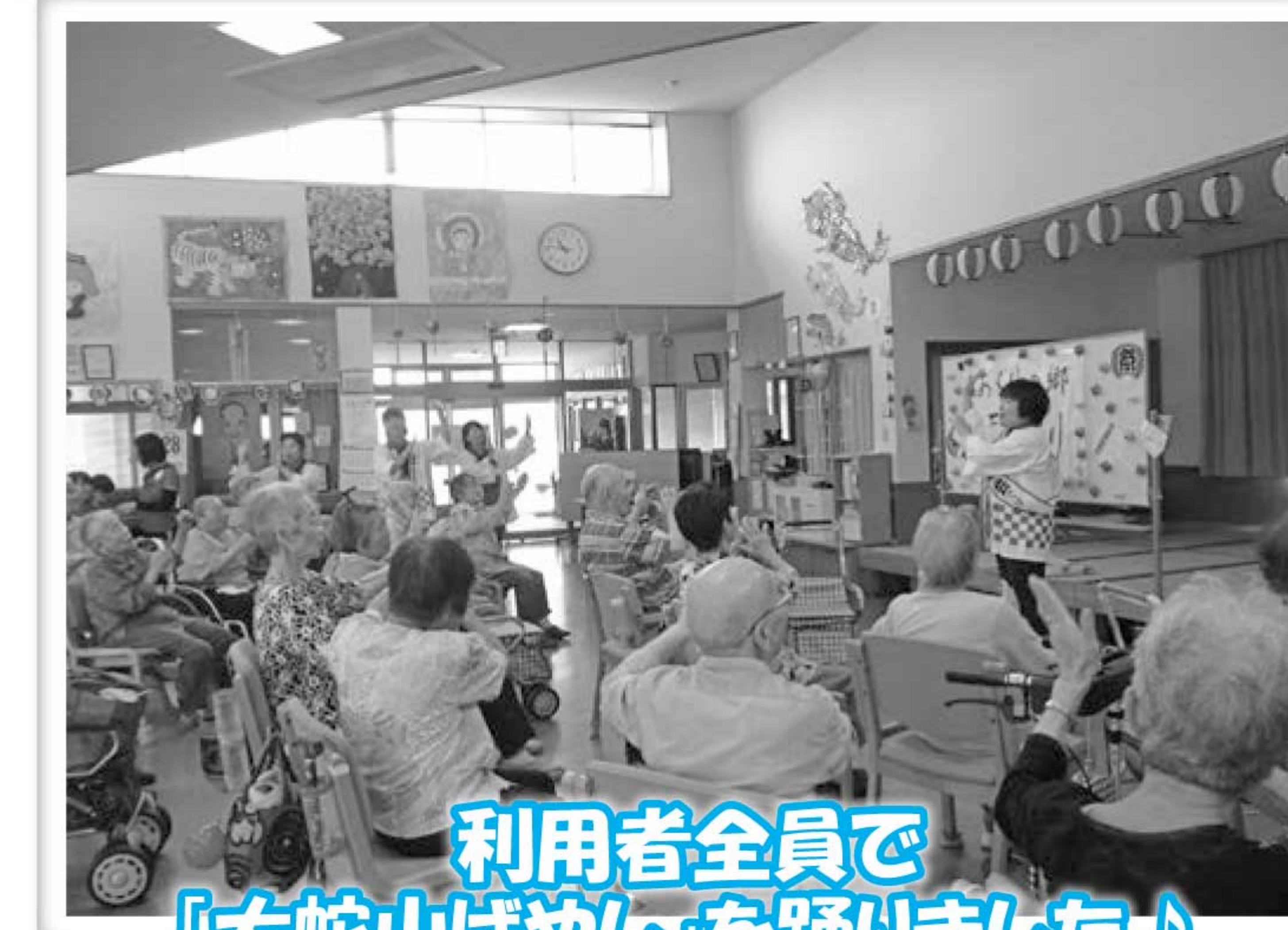
利用者全員で 「大蛇山ばやし」を踊りました♪