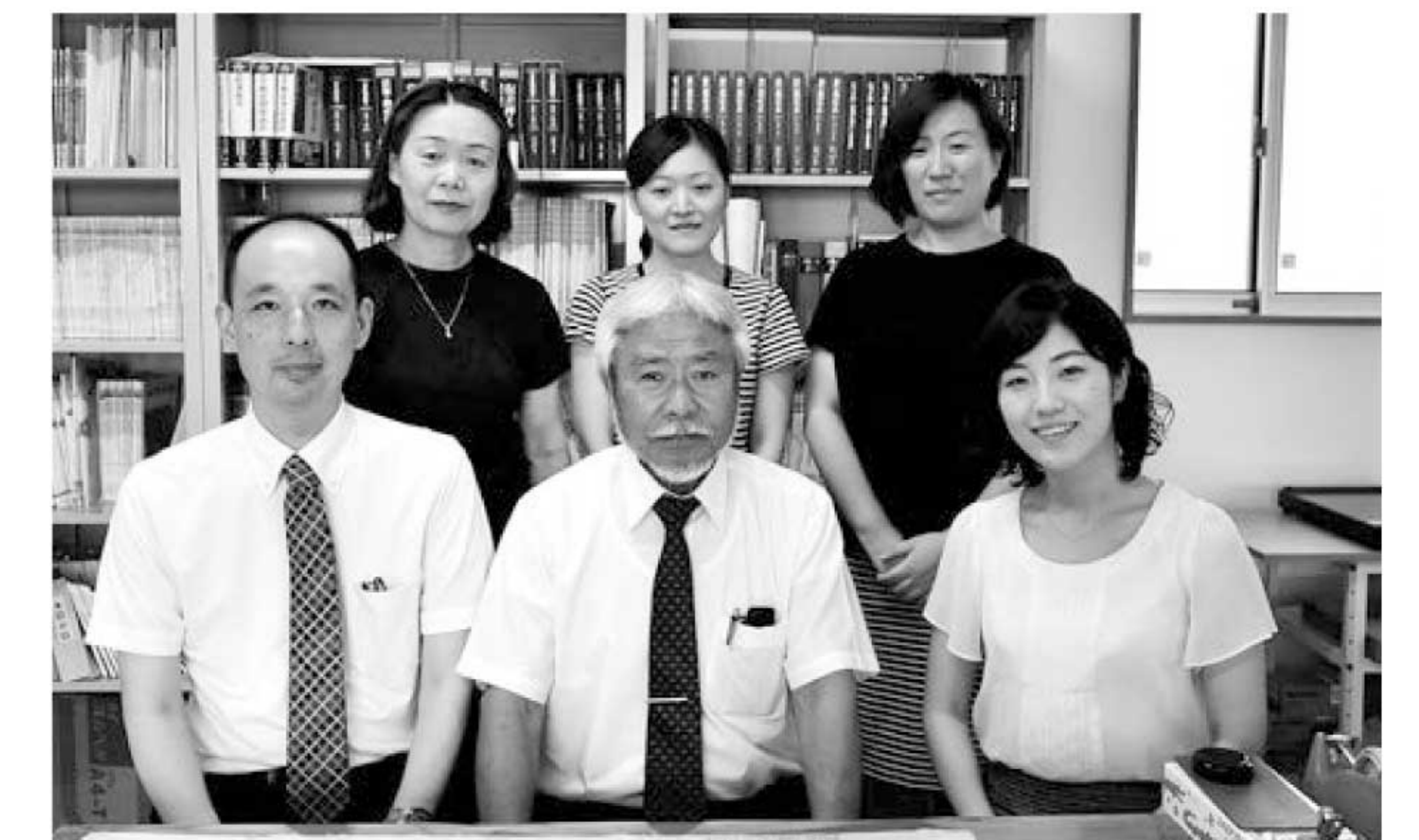
▲板橋事務所のみなさん