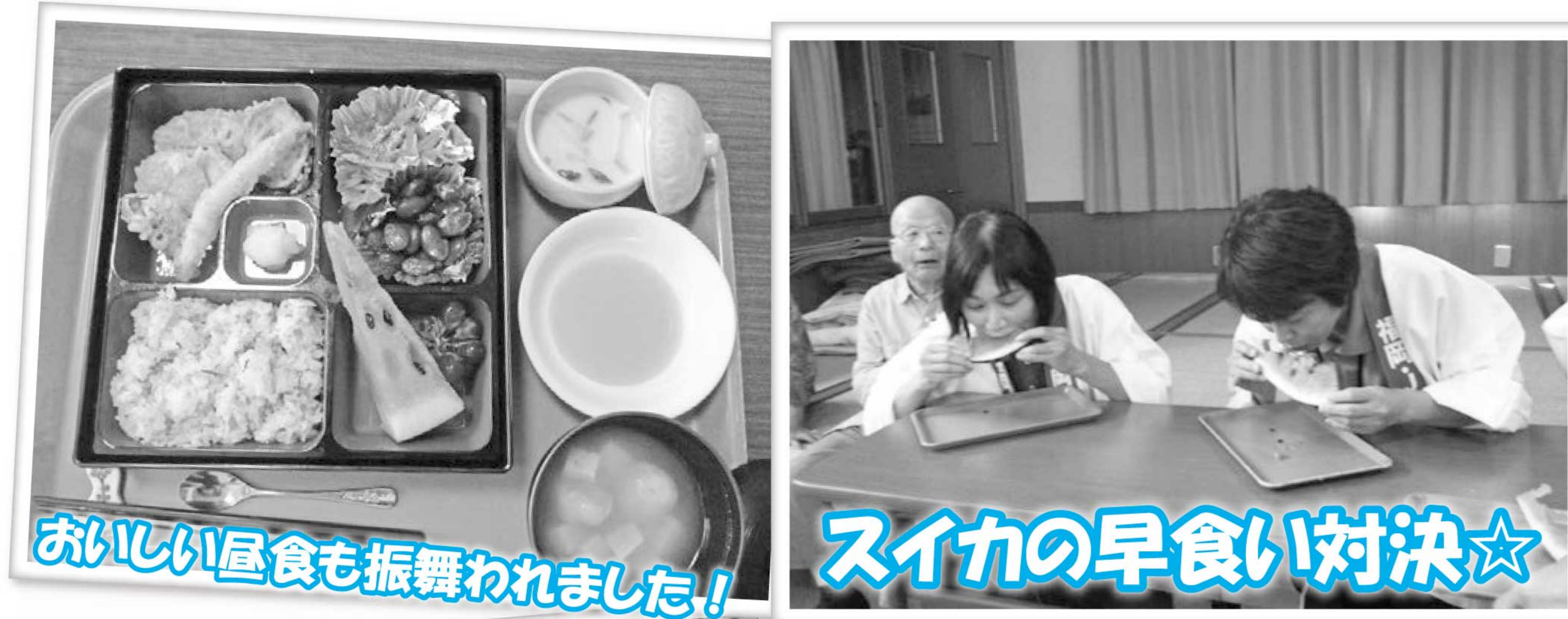
おいしい昼食も振舞われました!