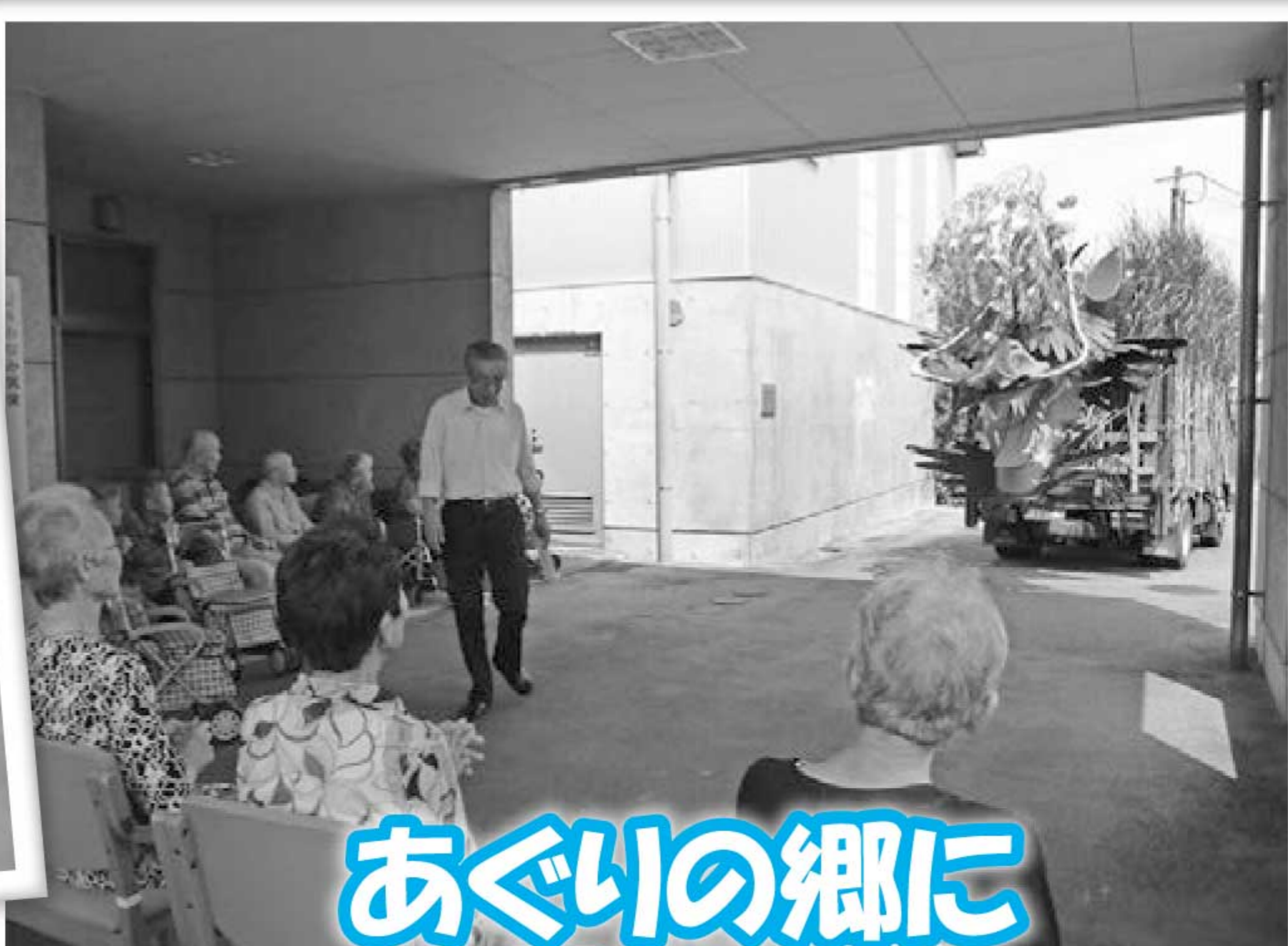
あぐりの郷に 大蛇登場!