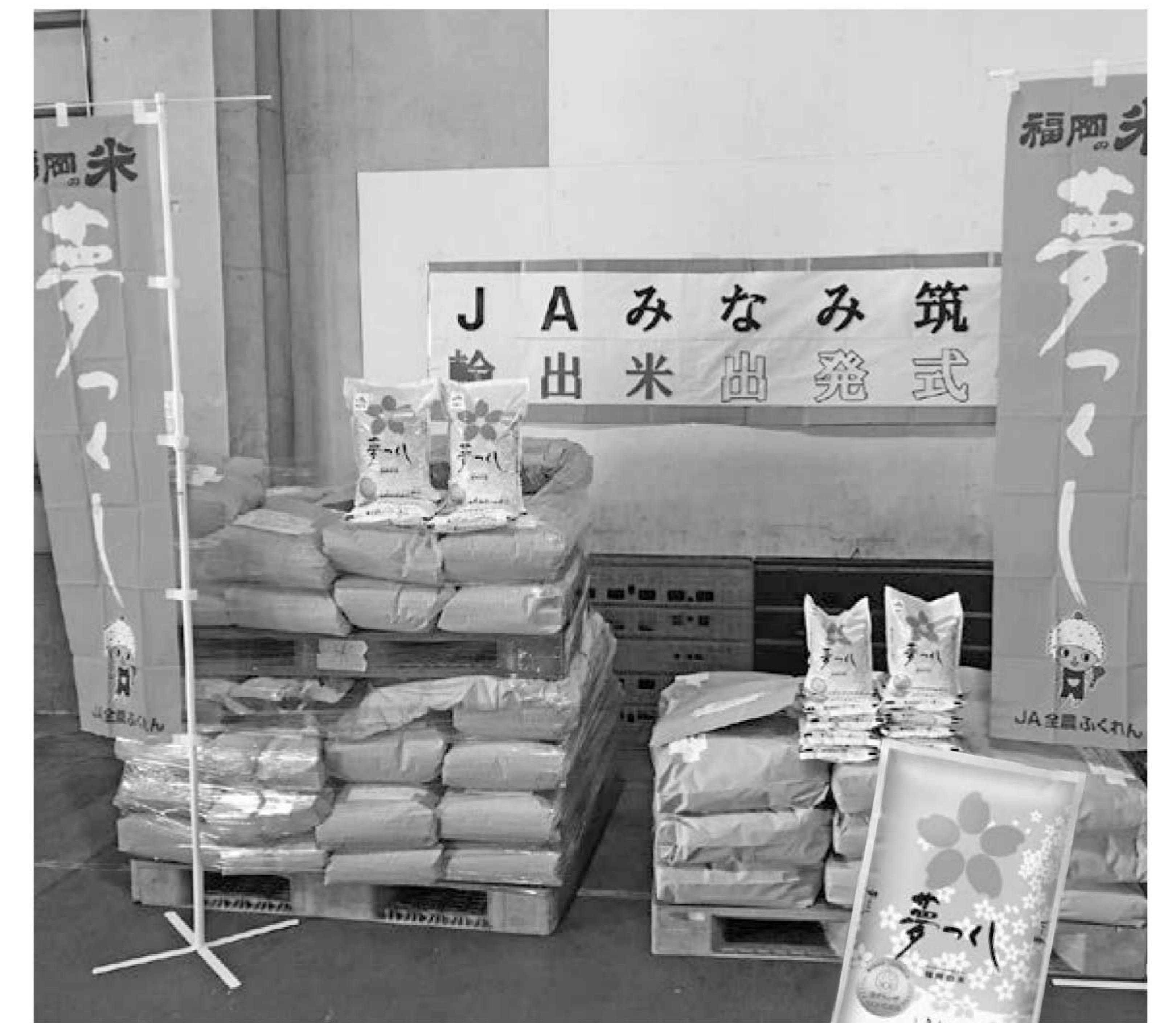
▲輸出される「夢つくし」

JAみなみ筑後は7月23日、シンガポールへの米輸出のために福岡市にある全農ふくれんライスセンターで出発式を行い、米を積んだトラックが横浜港へと出発するのを見送りました。今回は、JA産の夢つくし（1袋2キ入り）と精米製品（5キ袋合計1,500キ）を、横浜港を経由して輸出します。米は現地の量販店で販売され、在庫が減り次第、