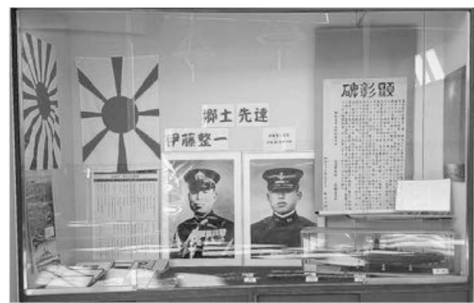
▲まいピア高田の常設展示