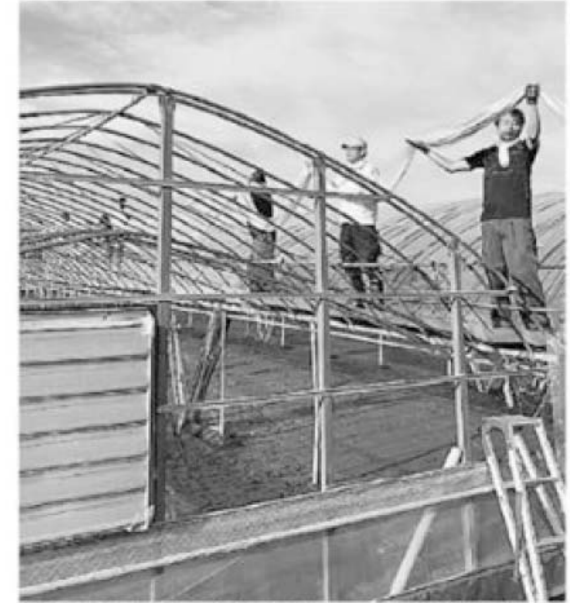
パイプハウスの天井ビニール張りの作業に助むあぐり支援隊員

福岡・みなみ筑後「あぐり支援隊」の活動が始まりました。JAみなみ筑後では9月上旬から、高齢農業者らのビニールハウス被覆作業を皮切りに、パイプハウスの天井ビニール張りの作業を支援する「あぐり支援隊」が、5年目を迎える。今年で15年度に達し、今年度は、