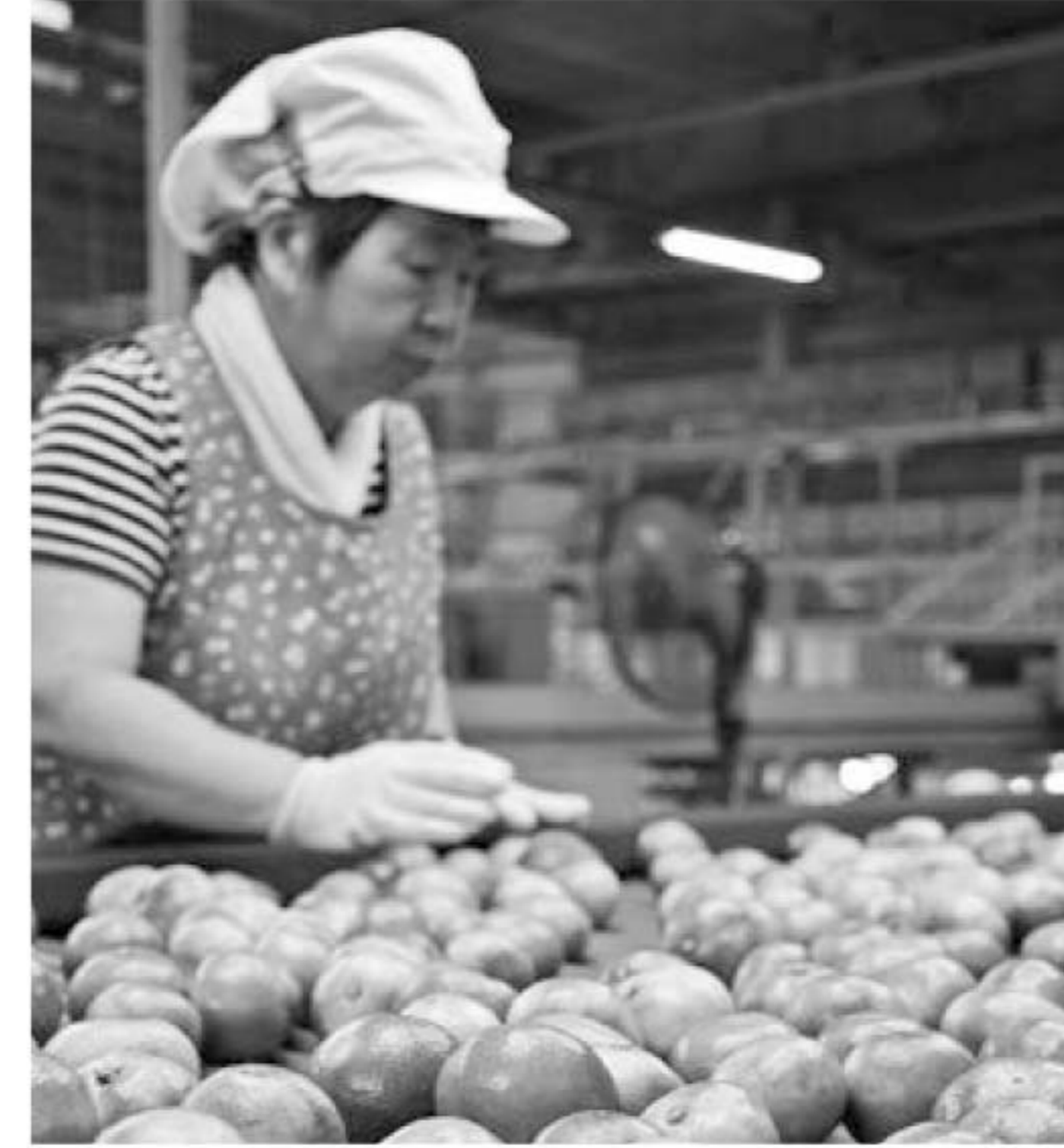
▲日南の姫を選果する作業員

山川選果場は極早生みかん「日南の姫(ひなのひめ)」の選果で活気を見せています。選果は14日から始まり、今年産は、生産者の適切な栽培管理により果実内容は良好で着色も進み、階級はS中心の糖度約9.0度、酸0.9%という仕上がりになっています。 また、福岡の奨励品種である「早味かん(はやみかん)」については、9月17日より出荷を開始し、その後極早生みかん「日南1号」へと続き、極早生の出荷は9月下旬をピークに10月中旬まで、「北原早生」については10月中旬より出荷、引き続き早生の集荷を予定しています。主に関東北陸・九州へ出荷し、集荷量は全体で7000トを見込んでいます。