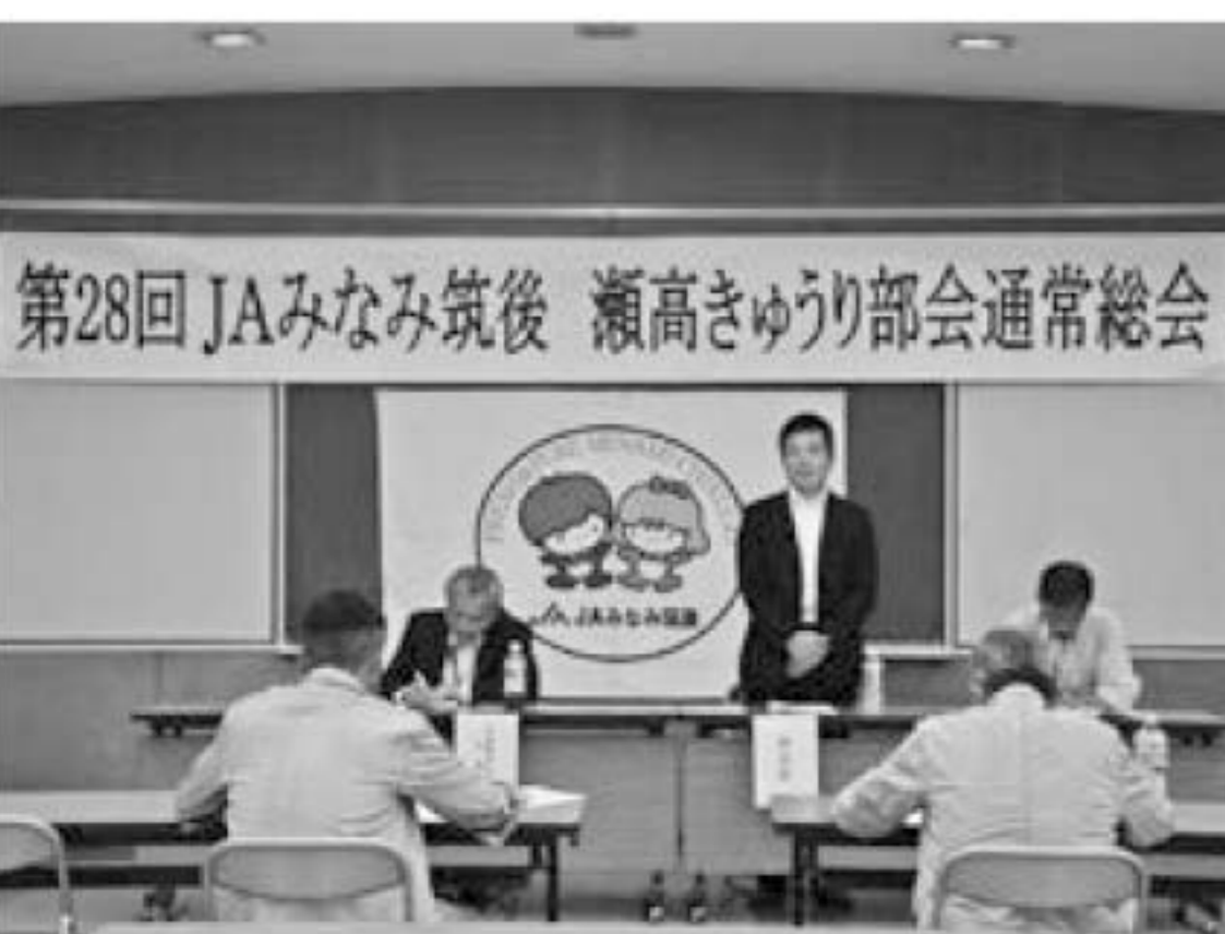
▲挨拶をする部会長

総会終了後には、販売検討会が開催され、平成31年度の販売経過実績報告と各市場の販売経過や次年度の販売対策について質疑応答も交えて検討会が行われました。