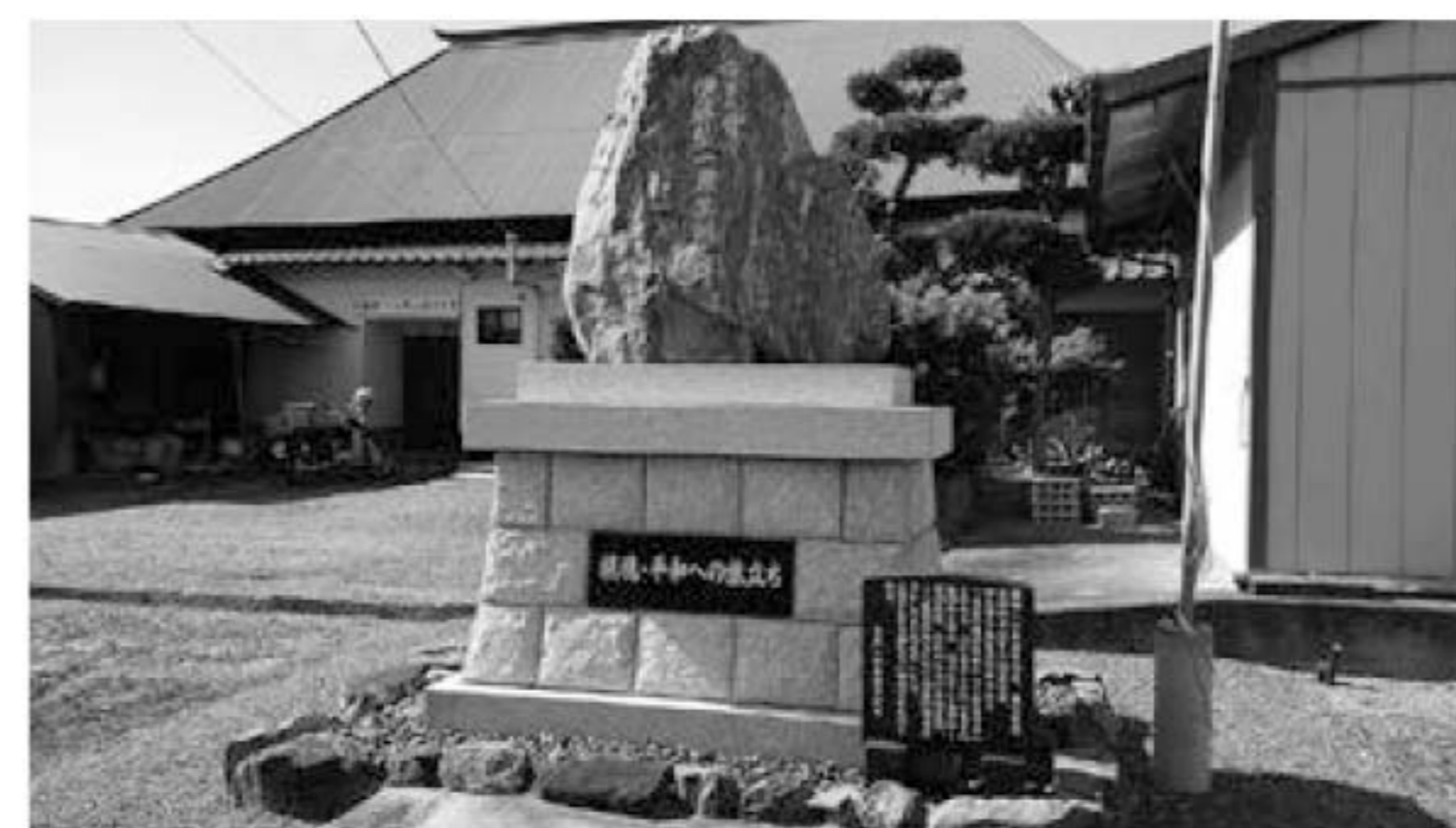
▲伊藤整一海軍大将の生誕の碑・生家

伊藤整一海軍大将の家が、開(御手作)地区にあります。まいピア高田には、常設展示もされています。