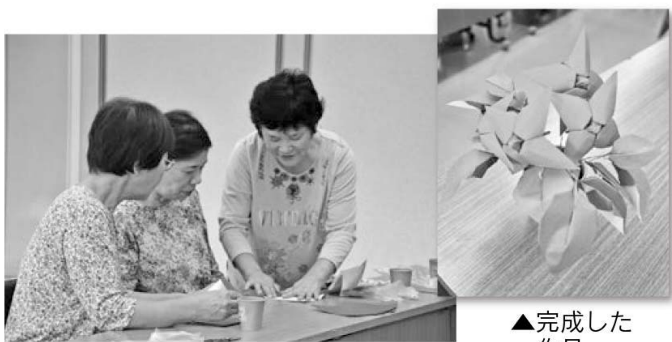
▲折り紙教室の様子