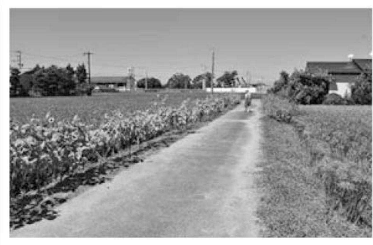
彼岸花やコスモスも咲いていて、色とりどりでした! ▶

組合員の方より「田んぼのあぜ道にひまわりを植えたらとてもきれいに咲いたよ～!」というお電話をいただき、写真を撮りに伺いました。鮮やかなきいろのひまわりが道沿いにたくさん咲いていてとてもきれいでした!