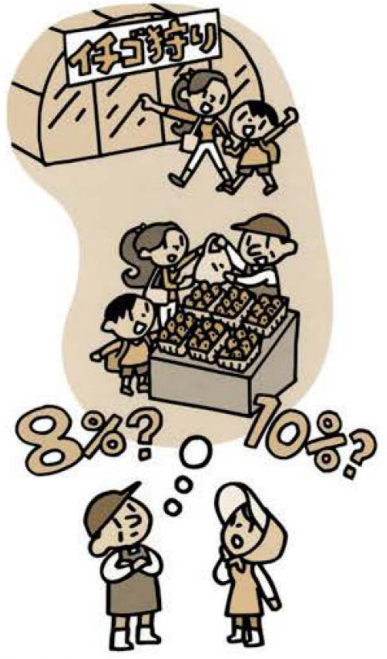
イラスト：服部新一郎

2023年10月1日の適格請求書等保存方式の導入後は、原則として「適格請求書」等を保存しておかなければ仕入税額控除を行うことができなくなります。区分記載請求書の場合と同様に、農家の方が事業者に農産物を販売する場合、相手先から適格請求書の交付を求められることとなります。適格請求書を発行するためには、税務署長に登録申請書を提出(2021年10月1日より申請受付)し「適格請求書」を交付することができる適格請求書発行事業者として登録を行う必要があります。ただし、適格請求書発行事業者になるためには消費税の課税事業者であることが必要です。免税事業者である場合は、あえて課税事業者になることを選択しなければ適格請求書 発行事業者になることができます。そのため、「農協特例」が手当てされます。この特例は生産者が適格請求書発行事業者であるかどうかにかかわらず、JAに対して無条件委託・共同計算により販売委託された農産品について、適格請求書の代わりにJAが発行した請求書で買い手が仕入税額控除を行うことができるというものです。無条件委託とは、農家の方が出荷した農産物について、売値、出荷時期、販売先などの条件を付さずに販売委託するものです。また、共同計算方式とは一定期間にJAが販売した同種、同規格、同品質ことの農産物の平均価格によって精算する方式をい