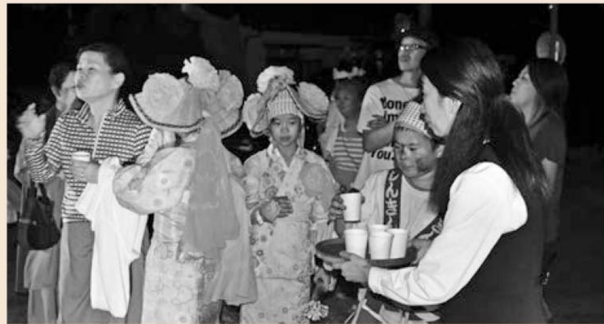
▲スープを振舞う職員

上内支所は9月25日、管内の大牟田市上内岡天満神社で行われた「銭太鼓(せんでこ)踊りとひゅうたん廻し」で、地域とのふれあい活動として同JAが開発したフリーズドライ商品「まるごとセロリと卵のスープ」を提供し、来場者に振舞いました。