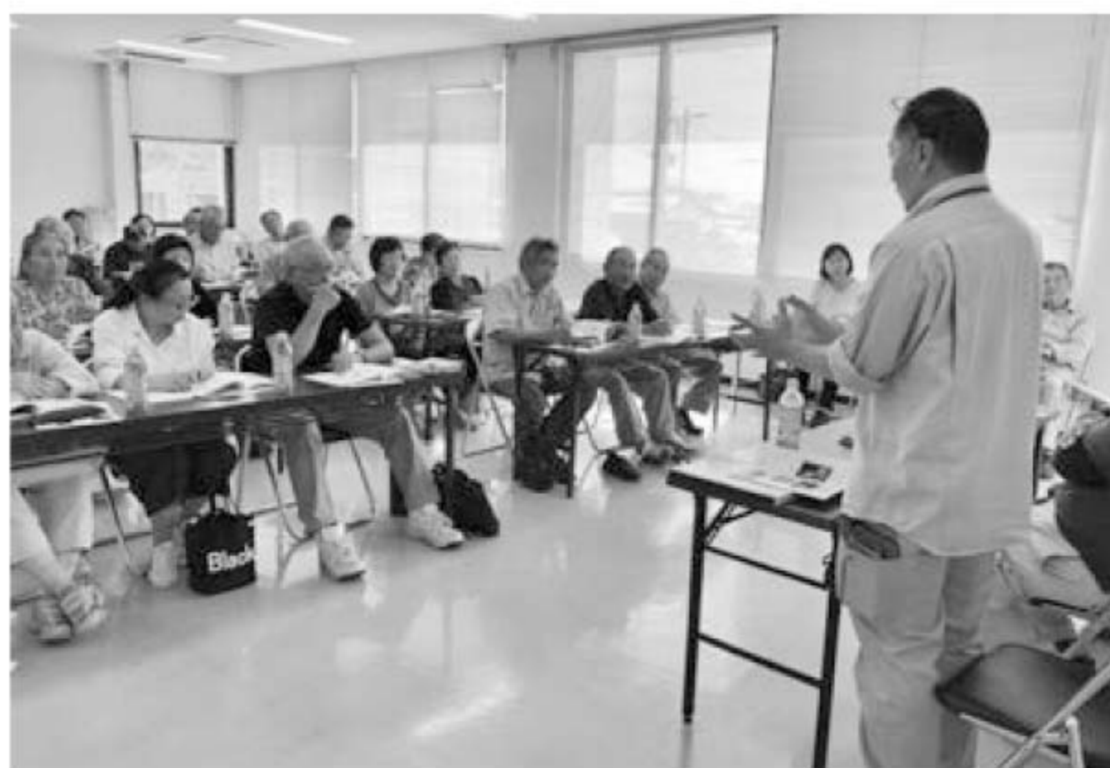
▲熱心に話を聞く参加者

9/17 上内支所女性部活動 折り紙教室開催！ 上内支所女性部は9月17日、支所2階で折り紙教室を開き、女性部員10人が参加しました。折り紙教室の開催は今まで例がなく、初の試みです。折り紙教室では赤やピンクのきれいな折り紙を使って立体的な花を作りました。参加した女性部員は「折り紙をするのは久しぶりで難しかったですが、素敵な作品ができてよかった」と笑顔で話しました。