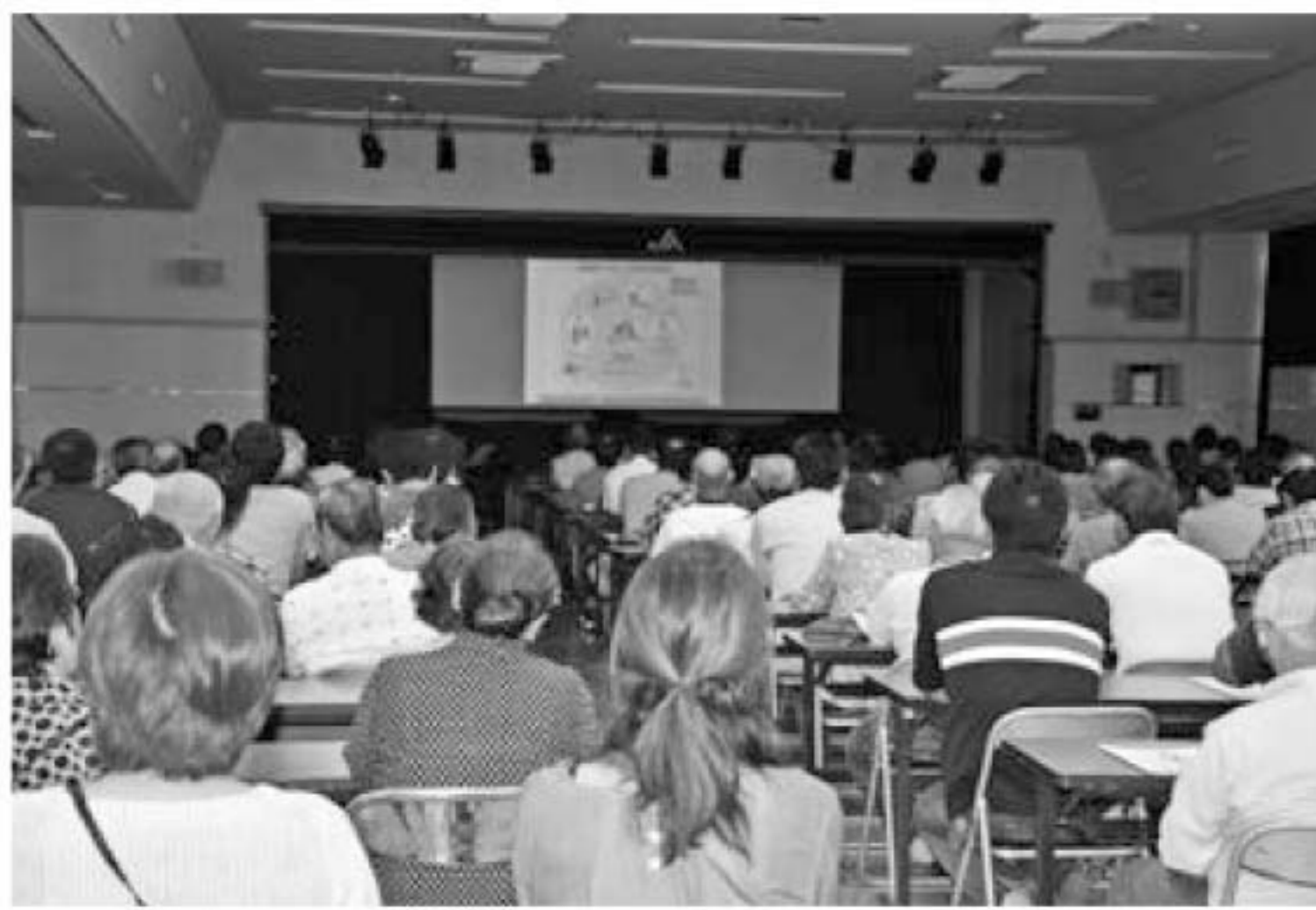
▲説明に熱心に耳を傾ける会員

青色申告会は9月19日と20日の二日間、JA本所と二川支所で消費税率の軽減税率制度に関する研修会を開き、2日間で会員260人が出席しました。10月からの消費税率改正に對するため軽減税率制度についての知識を深めました。