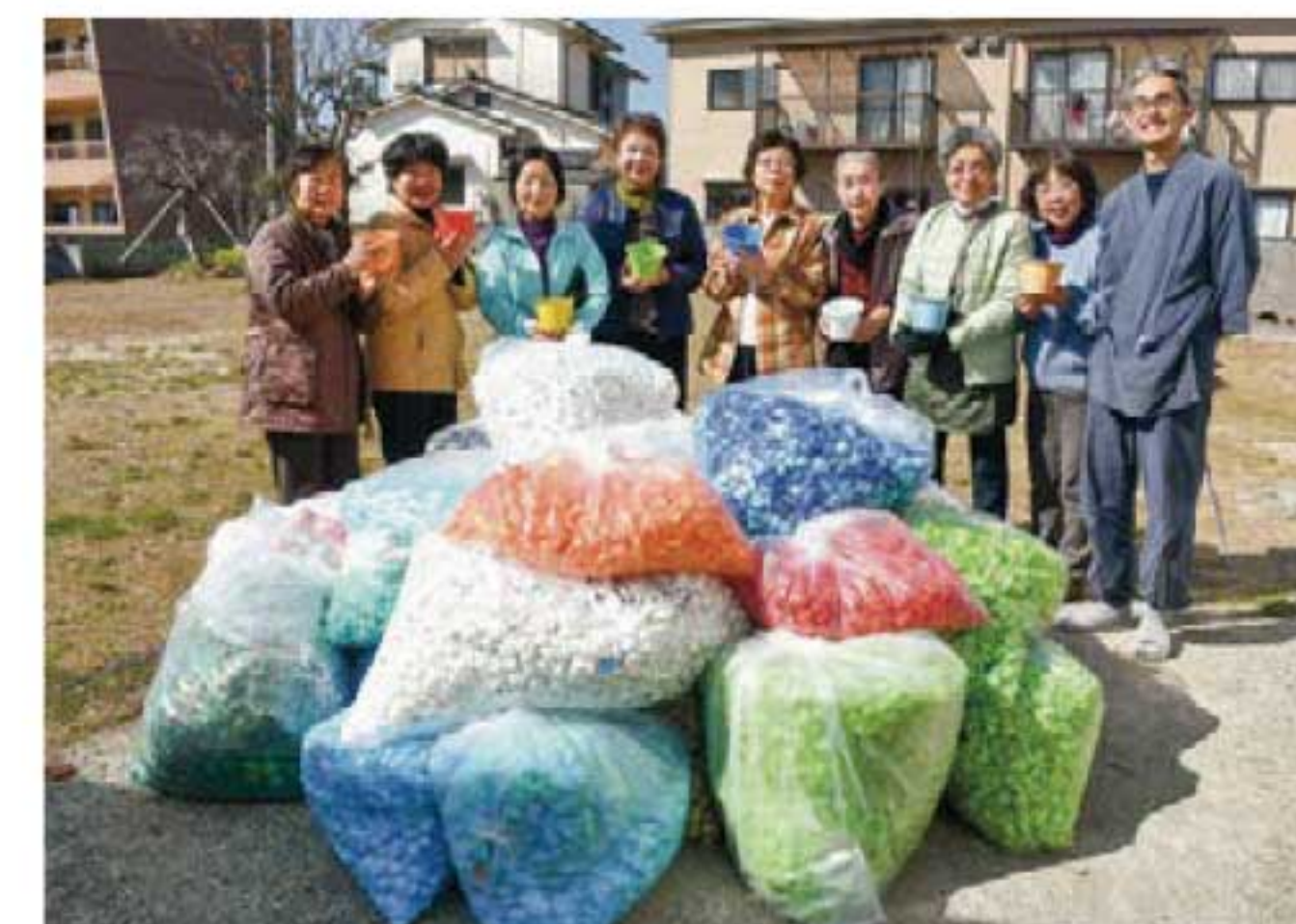
▲坂西内科医院へキャップを寄付！

女性部は2月6日、エコ活動の一環として集めていたペットボトルキャップ238.2kgを大牟田市の坂西内科医院へ寄付しました。