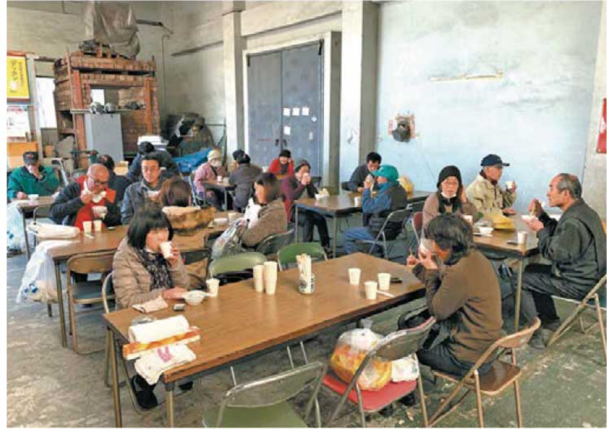
▲ぜんざいは大人気でした!!