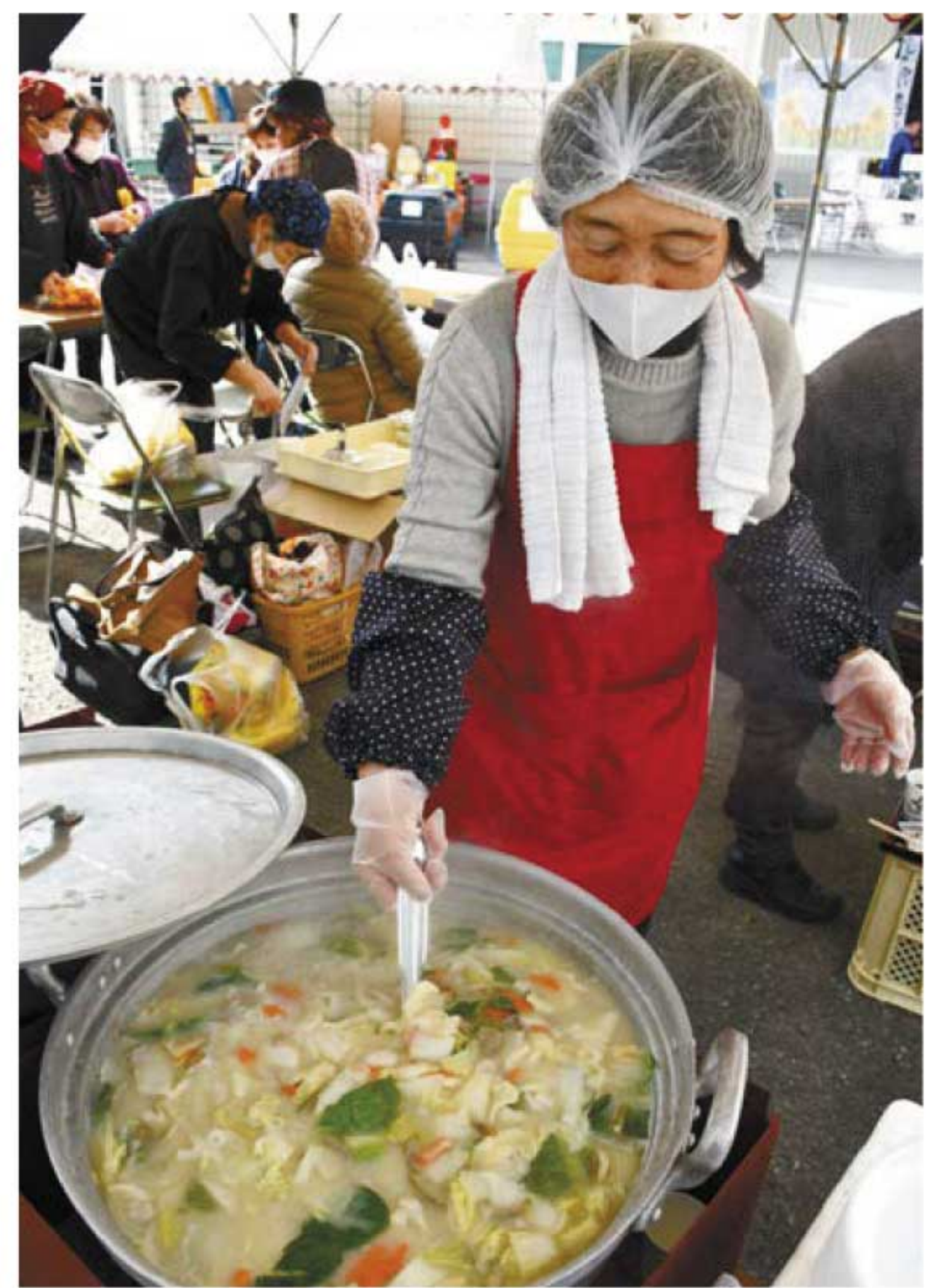
／地元野菜たっぷり! だご汁