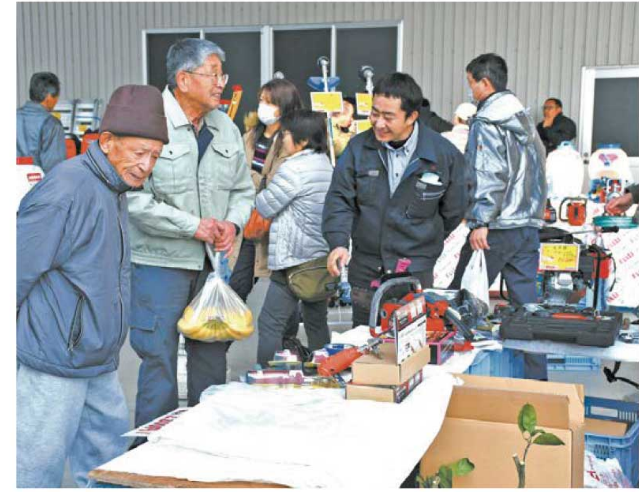
▲農機具の展示・販売

2月7日、8日の2日間、組合員・地域住民へ日頃の感謝を込め、山川選果場・山川グリーンセンター前広場で「あぐりフェアin山川2020」を開催しました。農機具、車両、肥料、農薬をはじめガス器具、生活資材、生産資材などを数多く展示・販売し、2日間ともたくさんの来場者で大賑わいでした。たくさんのご来場ありがとうございました!