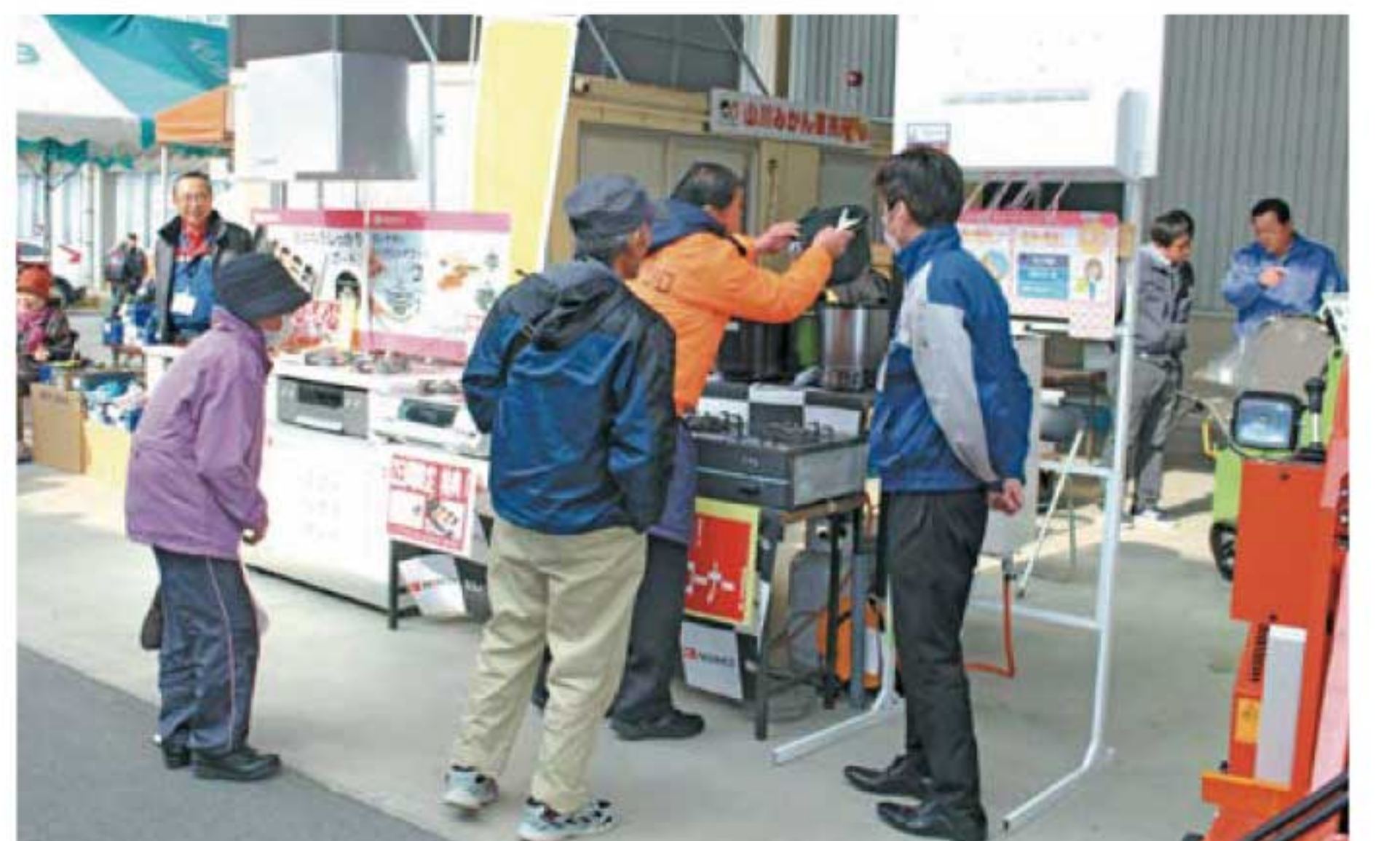
▲ガス器具展示・販売