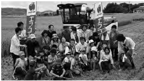
『稲刈り:Fコープ会員との交流会』