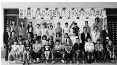
『第2回あぐりキッズスクール(入学式)』