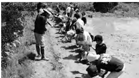
『田んぼの教室:田植え』