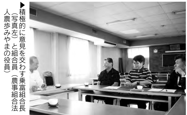
▶積極的に意見を交わす乗富組合長（写真左）と組合員（農事組合法人農歩みやまの役員）

9/11 安全・安心を消費者へ 山川たけのこ部会通常総会 山川たけのこ部会は、山川支所で通常総会を開き、各支部役員16人が出席。全4議案を協議し、平成29年度は「安全・機能性・健康」に富んだ農産物を消費者に届けることを基本に、早堀りのための親竹及施肥管理の徹底や裏止め実施による伐竹作業軽減など生産対策4点と、品質管理の徹底など販売対策2点を決めました。合わせて、新鮮なたけのこを付加価値の高い早期出荷できる園地管理・肥培管理を実施し所得向上に努め、市場への的確な産地情報の把握と提供を行い、有利販売へつなげていきます。