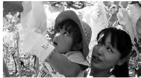
『ぶどう狩り:保育園児の収穫体験』