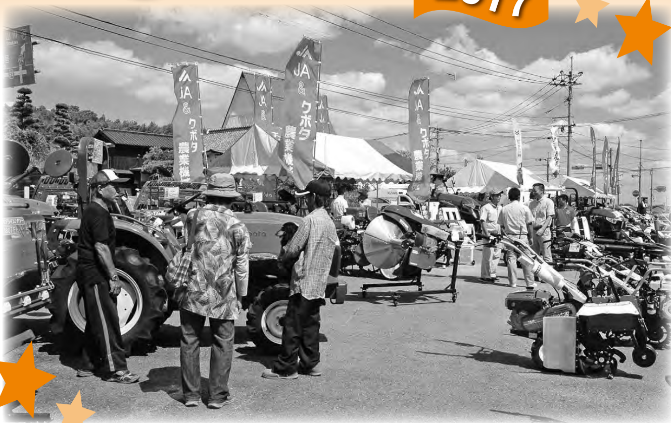
▲農機具の展示・販売では、実際に乗車したり説明を聞いたりと多くの人で賑わいました。