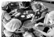
◀テンペご飯を調理する山川支所女性部員