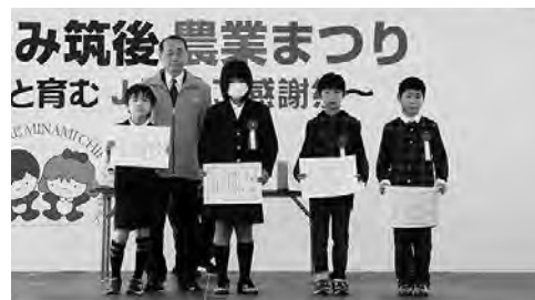
『まるごとみやま秋穫祭:よい食PR』