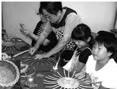
◀完成した小物入れ