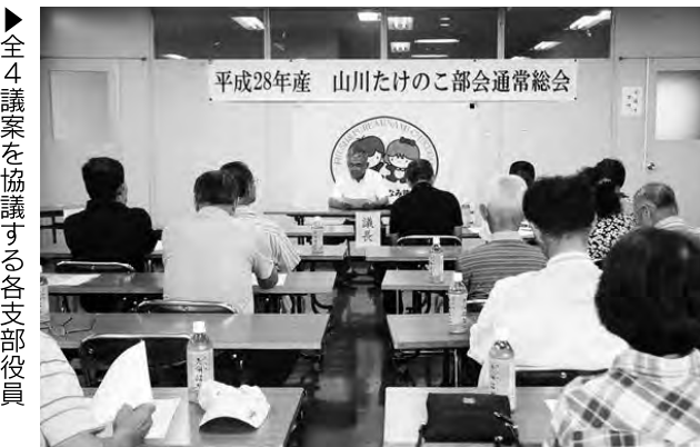
▶全4議案を協議する各支部役員