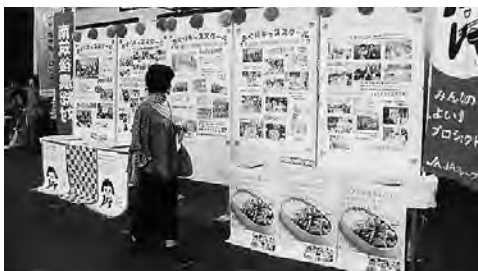
『まるごとみやま秋穫祭:よい食PR』