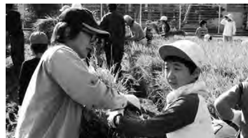
『田んぼの教室:稲刈り』