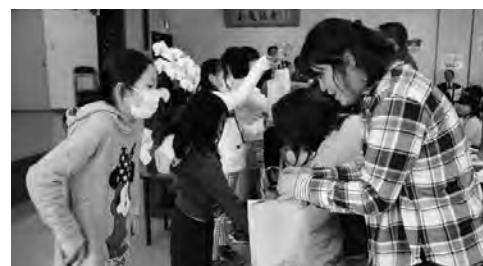
『あぐりキッズスクール(卒業)作ったお弁当を保護者へ手渡す。』