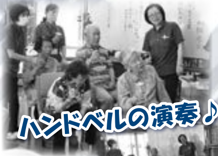
ハンドベルの演奏♪