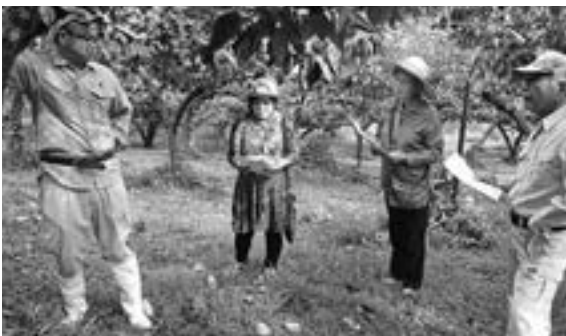
▲普及指導センター職員(写真左)より指導を受ける生産者

次年度の結実安定生産を目指すため、南筑後普及指導センターと連携し、梨秋期管理講習会を開催。管内の梨園地で現地指導を行いました。 講習会には、梨生産者約4人が参加し、次年度結果枝(花芽)の充実と冬期せん定の省力化を目的に秋期せん定の方法、かん水、土づくり、施肥等の管理や病害虫防除について再度確認を行いながら、今後の栽培管理上の留意点を普及指導センターの職員が説明しました。生産者はメモをとったり質問をしたりと熱心に耳を傾け、積極的に講習会に参加しました。