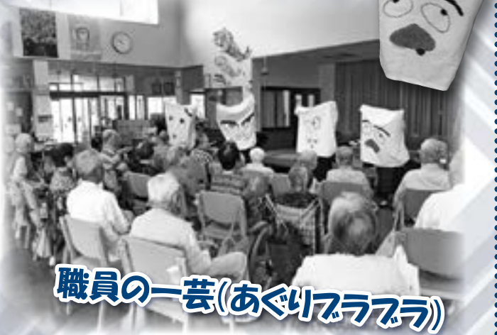
職員の一芸(あぐりブーブー)