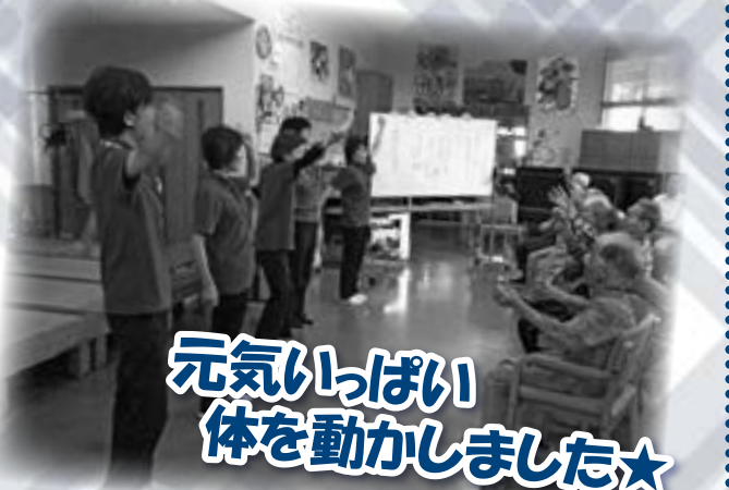
元気いっぱい 体を動かしました★