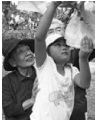
▶綺麗に色づいたぶどうを収穫する児童

収穫後は獲れたてぶどうをその場で味わい「甘くて美味しい」「これからもぶどうをたくさん食べます」と笑顔で話し、収穫の喜びを感じていました。