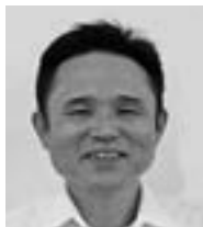
上野配置員 瀬高地区担当