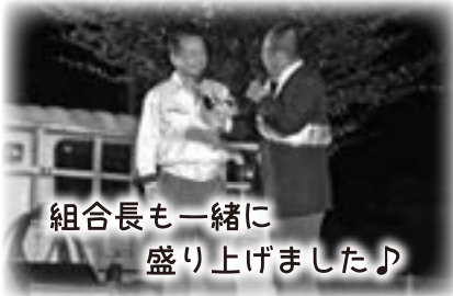
組合長も一緒に 盛り上げました♪