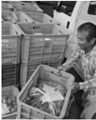
▶自慢のキウイフルーツを選果場へ持ち込む生産者

集荷されたキウイフルーツは、県内で共同出荷を行う為、JAFにおか八女に運ばれ低温貯蔵庫に入庫します。出荷する前の段階で追熟を行い、11月上旬から下旬にかけて関東を中心に出回る予定です。JAFみなみ筑後では、19ト、同JAFを含む5JAFでは、全体で80トの集荷を見込んでいます。