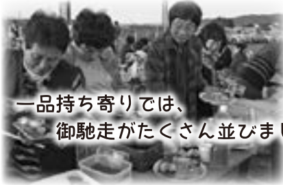
一品持ち寄りでは、 御馳走がたくさん並びました^^