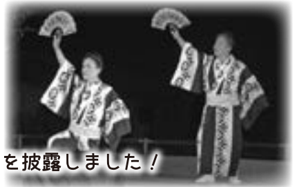
みんなで楽しく踊りました。