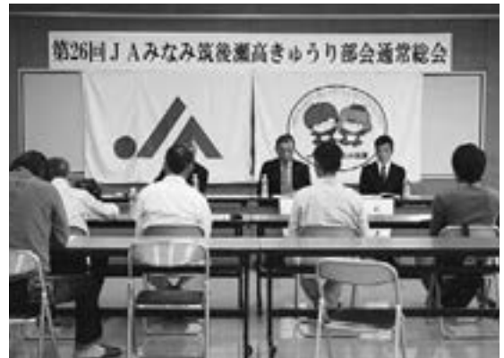
▶全4議案を協議する部会員

まず、はじめに同協議会より営農集落組織の法人化後のJAみなみ筑後としての関わり方について質問があり、JAでは、今後引き続き担い手支援課を中心に、JAグループ福岡担い手総合サポートセンターら関係機関と連携を図りながら、会計支援や新規作物栽培提案などの支援に関わっていくと回答しました。