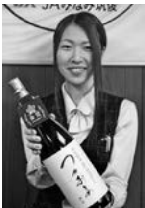
◀金賞を受賞したつやおとめ

9月6日、福岡市で開催された第6回福岡県酒類鑑評会で、日本酒の純米吟醸酒・純米酒の部において、特別純米酒「つやおとめ」が、見事金賞を受賞しました。