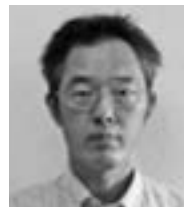
仲配置員 高田地区担当