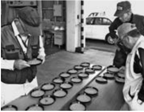
▲1粒ずつ病害虫の有無を確認していく検査員

今年産の生育は、田植え後の天候に恵まれ、分けつ数も確保でき、平年並みやや良の生育となりました。出穂は、平年に比べ2、3日早く、その後も順調に成熟期を迎えました。収穫は、台風の影響で9月19日から始まり、管内全体の荷受重量は539トです。担当職員は「お米の粒張、粒揃いも良く、品質良好のお米が採れました」と話しました。