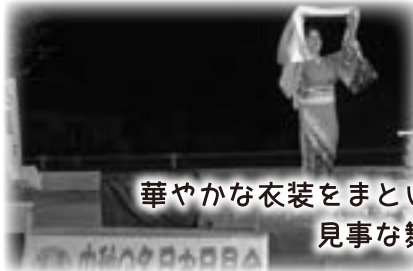
華やかな衣装をまとい 見事な舞を披露しました！