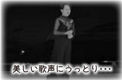
美しい歌声にうっとり…