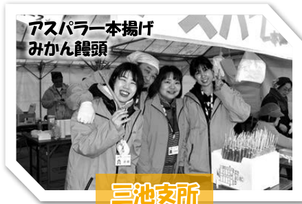
アスパラ一本揚げ みかん饅頭