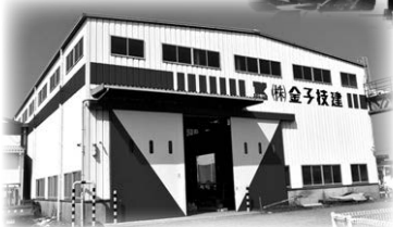
▲金子技建 鉄構事業部 浜田工場