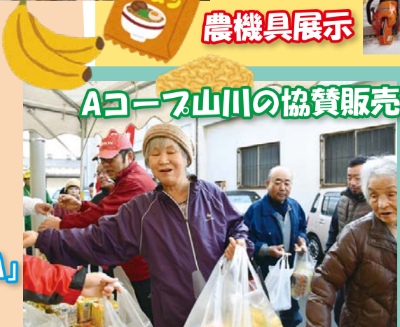
Aコープ山川の協賛販売