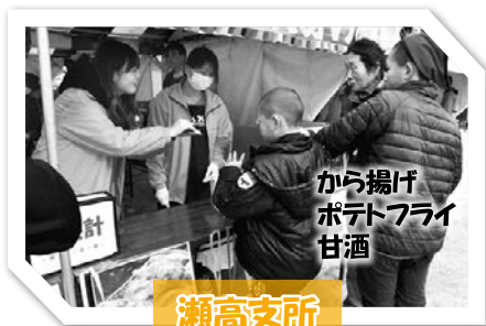
から揚げ ポテトフライ 甘酒