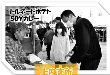
トルネードポテト SOYカレー