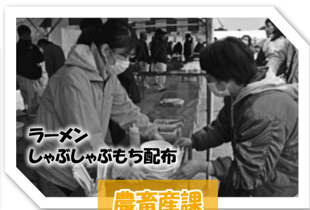
ラーメン しゃぶしゃぶもち配布