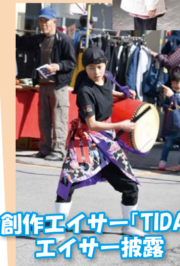
創作エイサー「TIDA」 エイサー披露