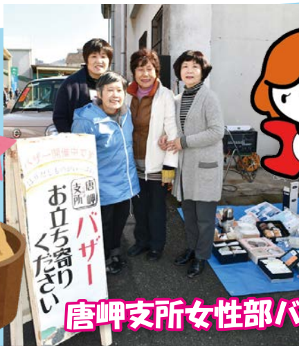
唐岬支所女性部バザー