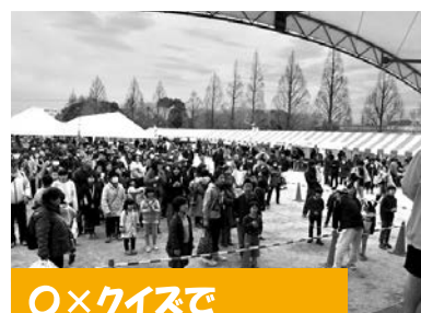
〇×クイズで 勝ち残った方に 賞品プレゼント! ▼