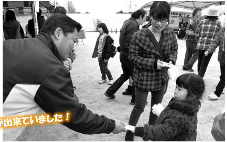
無料配布は大人気で、長蛇の列が出来ていました！

農業まつりでは、管内農産物直売所、営農部による新鮮な農産物販売や各支所ふれあい委員会と合同による出店などもあり、地元の食材を使ったおいしい料理を多くの人にPRしました。その他にも、地元米「元気つくし」や県産牛乳の無料配布、地元産もちつき大会、青年部による綿菓子販売、○×クイズ、しいたけコマうち体験、太鼓衆「響」の和太鼓演奏、大牟田高等学校吹奏楽部による演奏、野菜の重量当て、紅白もち投げなど子どもから大人まで楽しめるイベントが盛りだくさんで終日大いに賑わっていました。