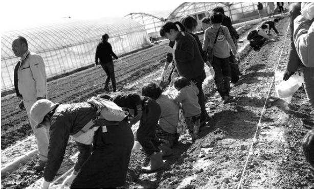
▲植付を楽しむ参加者

2月18日、瀬高支所は同支所ふれあい委員と協力し、瀬高支所ふれあいイベントとして「じゃがいも植えつけ」を行いました。植付には職員、ふれあい委員、小学生・保護者ら35名が参加しました。