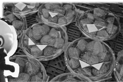
しいたけ コマ打ち体験！▶