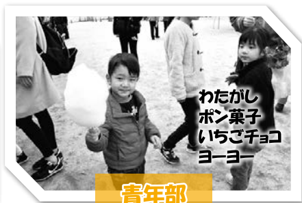
わたかし ボン菓子 いちごチョコ ヨーヨー