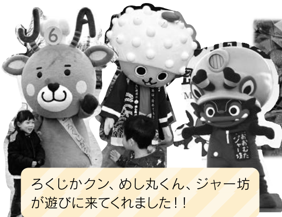
ろくじかくん、めし丸くん、ジャー坊 が遊びに来てくれました！！