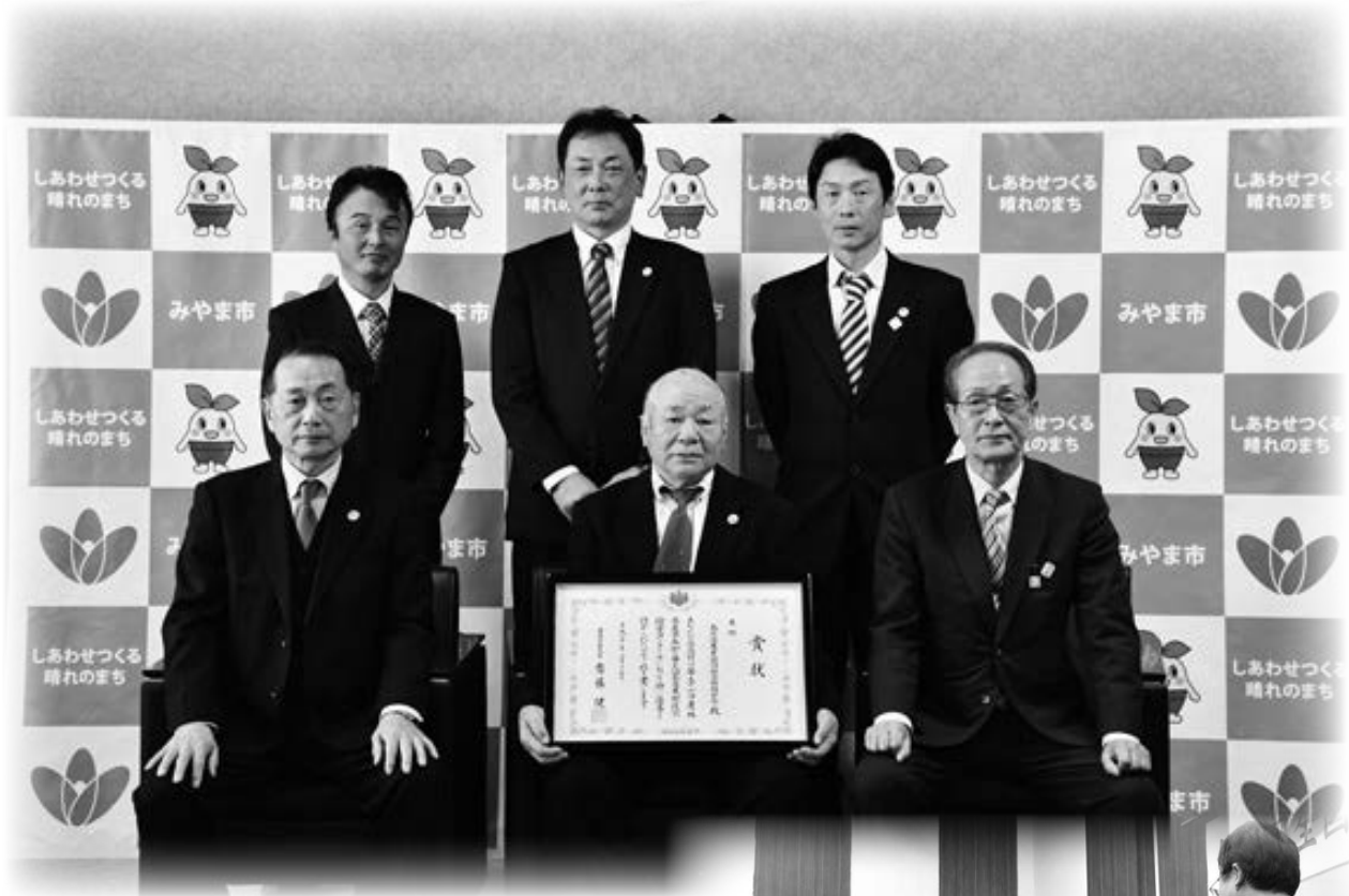
▲みやま市へ受賞報告