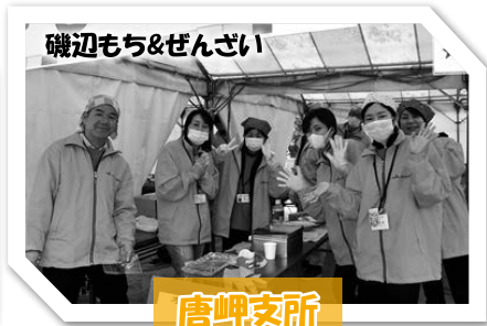
磯辺もち&ぜんざい