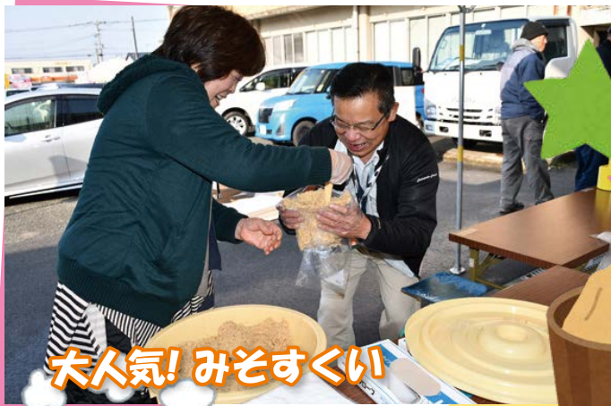
大人気! みそすくい