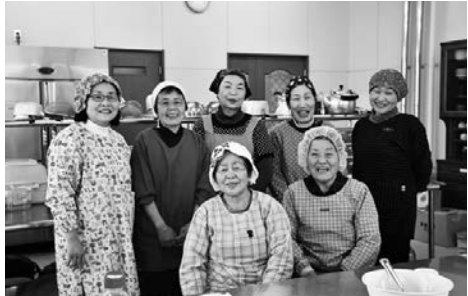
【キッチンJAひまわり】

「女性部なかま」は今回で最終回となります。ご愛読ありがとうございました！ ※きらり☆女性部は今月号はお休みです。