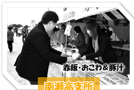
赤飯・おこわ&豚汁