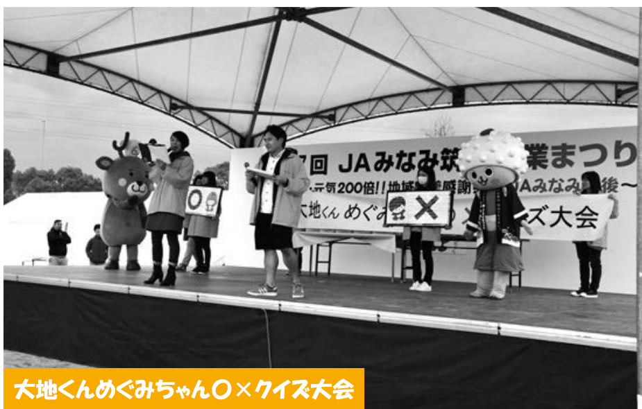
大地くんめぐみちゃん〇×クイズ大会