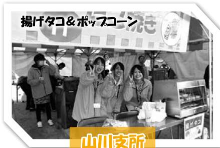
揚げタコ&ポップコーン