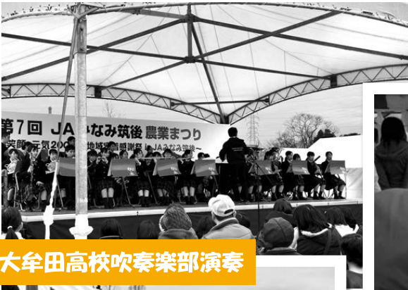
大牟田高校吹奏楽部演奏