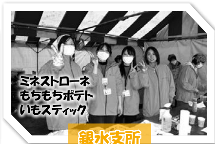
ミネストローネ もちもちポテト いもスティック