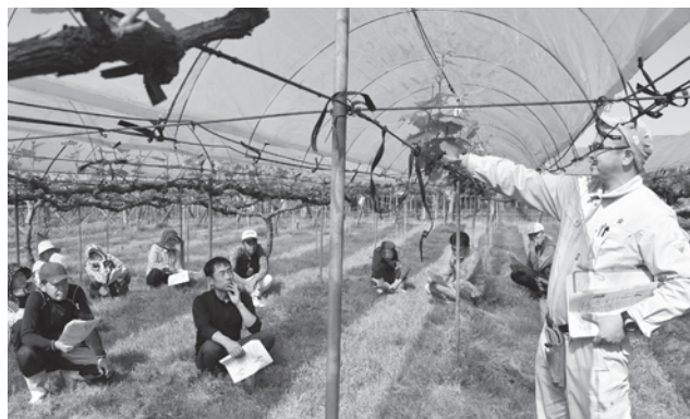
▲指導員の説明に耳を傾ける生産者

4月20日、南筑後普及指導センターと連携し、ぶどう春季管理講習会を開き、管内のぶどう園地を巡回し現地指導を行いました。同講習会は適切な生産管理を行うことにより結実安定生産を目指すことを目的として行われ