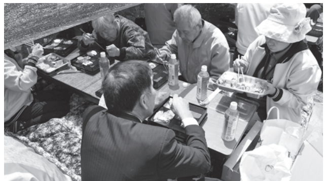
◀役員と楽しく食事をする利用者ら