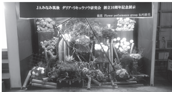
▲福岡花市場記念展示