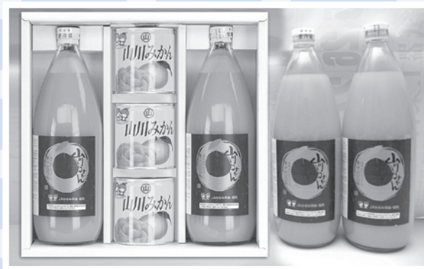
▲ギフトセットイメージ写真

お問合せはJAみなみ筑後山川選果場 (Tel: 0944-67-1211) まで。