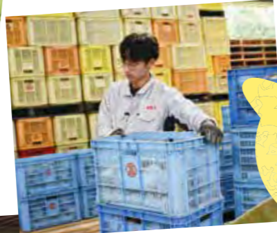
たけのこの荷受け作業