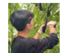
受け入れていただいた農家の皆様ありがとうございました!!