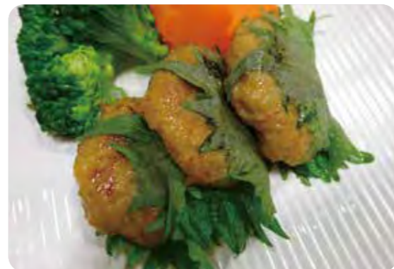
※写真は盛り付け例