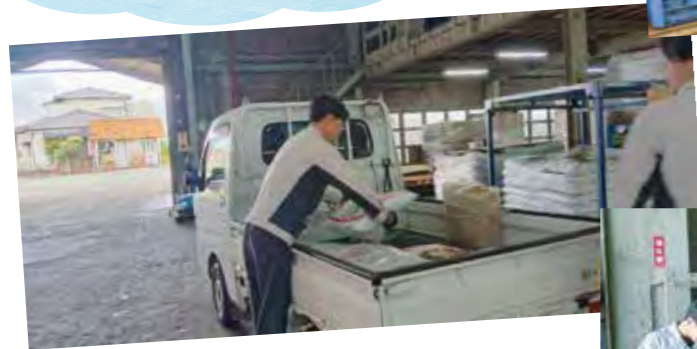
グリーンセンターで資材の荷積み