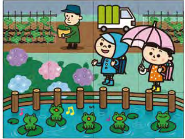
出題・イラスト:ゆきたけし